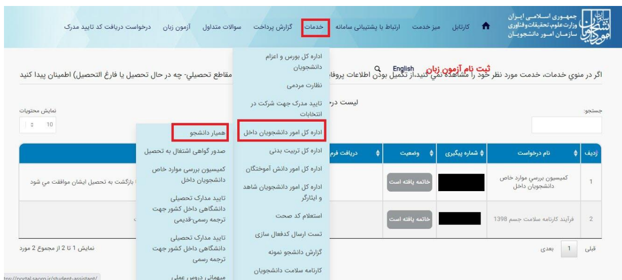
تصویر ۱ - انتخاب فرایند همیار دانشجو در پورتال

از جمله فرآیندهای اداره دانشجویان داخل، ثبت درخواست همیار دانشجو است. متقاضی قبلا در پورتال سامانه جامع امور دانشجویان (سجاد) ثبت نام کرده و نام کاربری و رمز عبور دریافت نموده است و پس از ورود به پورتال درخواست فوق را از سربرگ خدمات، بخش امور دانشجویان داخل، گزینه همیار دانشجو را انتخاب و اقدام به ثبت درخواست می کند (چنانچه دانشگاه مورد نظر در لیست دانشگاه های تعریف شده در سامانه نباشد پیغام اخطار تصویر ۳ نمایش داده می شود). پس از ثبت درخواست و دریافت کد پیگیری توسط متقاضیانی که امکان مشاهده و ثبت این درخواست را دارند، درخواست توسط کارشناس مسئول همیاران دانشجو هر دانشگاه، بررسی می شود و در صورت تایید یا عدم تایید درخواست ها، وضعیت فرایند در پورتال به "خاتمه یافته" تغییر پیدا خواهد کرد و متن مناسب در بخش توضیحات به متقاضی نمایش داده خواهد شد. (تصاویر ۱ و ۲)